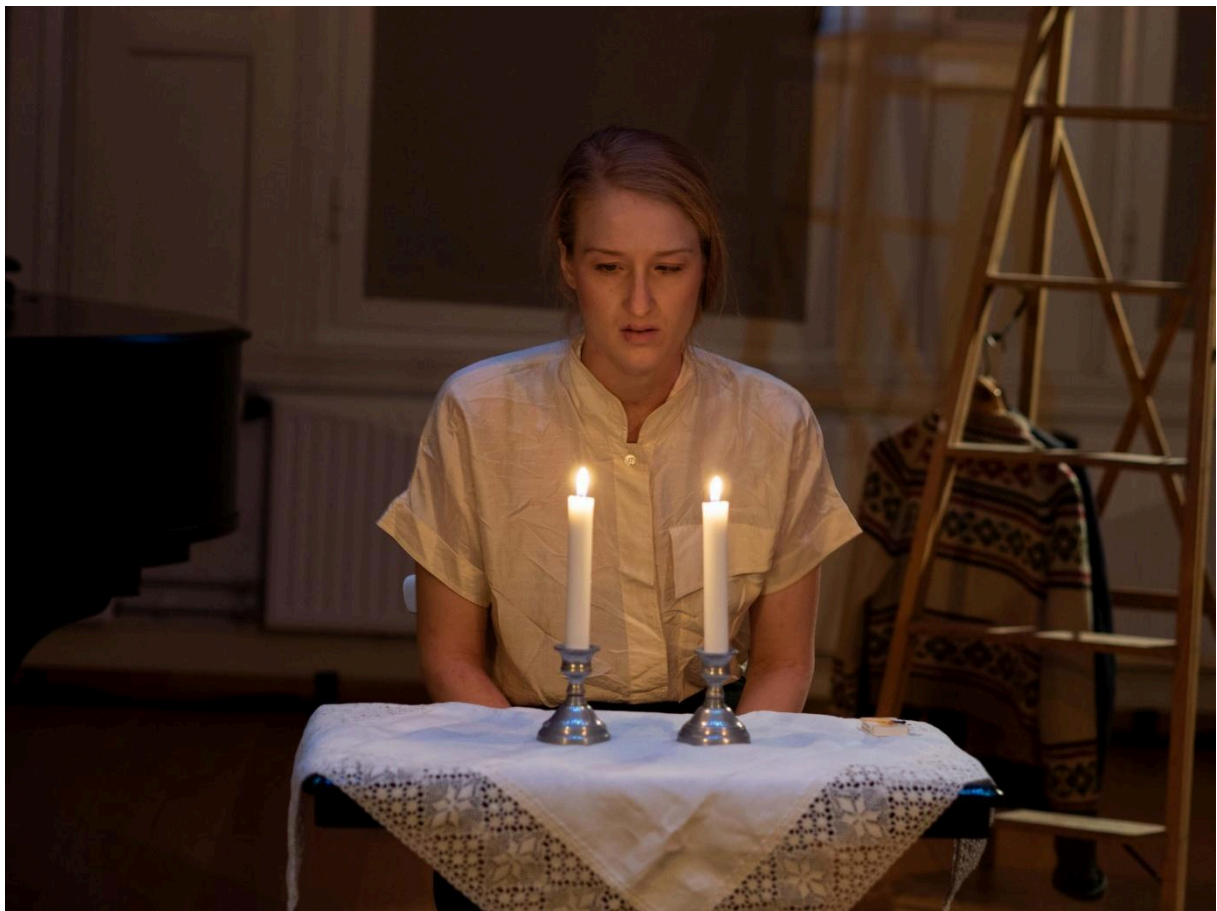
Foto: Kari Melhuus Jenssen under forestillingen «hjemkomst. Foto: Ulf I. Gustafsson

Den nye handlingsplanen ble lansert i oktober 2024, og vil være gjeldende til ut 2030. Vi er takknemlige over at Regjeringen så resolutt vedtok en ny og omfattende satsning, og som vi er glade å kunne være del av.