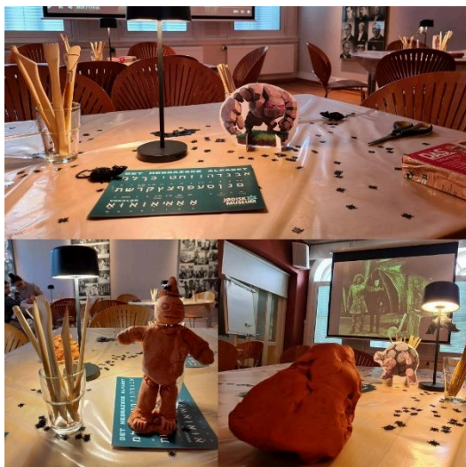
Noen av de flotte leirfigurene som ble designet av våre besøkende.

Under årets Kulturnatt bidro JmT med byvandring til Metodistkirken og den hemmelige synagogen. Tilbudet var et samarbeid mellom JmT og Metodistkirken. Inne i museet hadde vi også gratis tilbud med leirverksted for alle barn med temaet Golem, samt fremvisning av en gammel stum-film om Golem på storskjerm.